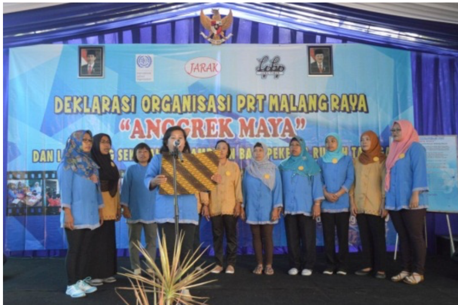
Gambar 2. Deklarasi Organisasi Anggrek Maya tahun 2017